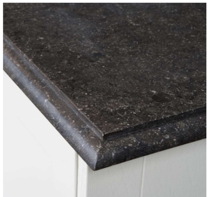
Sichtkante, ¼ stab