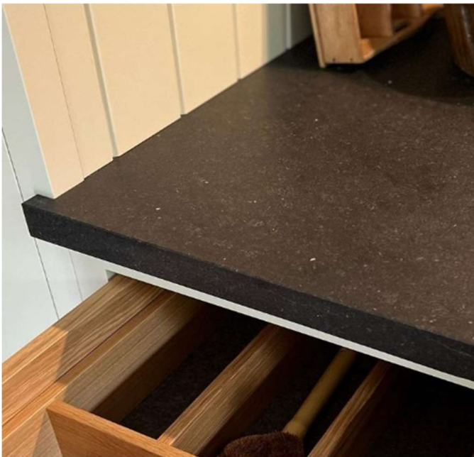
Sichtkante, leicht gefast