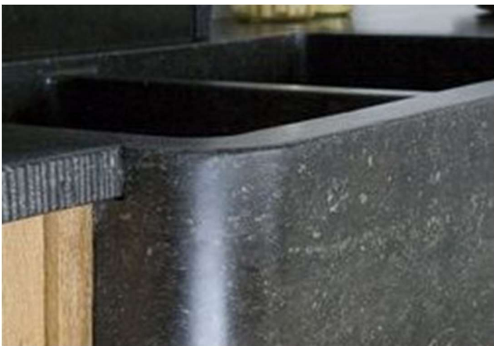
Massiver Spülstein mit gerundeten Ecken

Für alle Spülsteine ist kein Überlauf vorgesehen. Sollte dieser gewünscht sein, sprechen Sie uns gerne an!