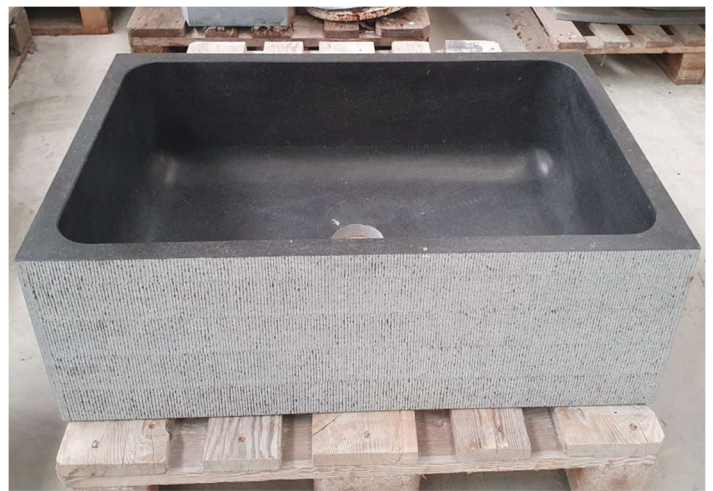
Massiver Spülstein, handscharriert